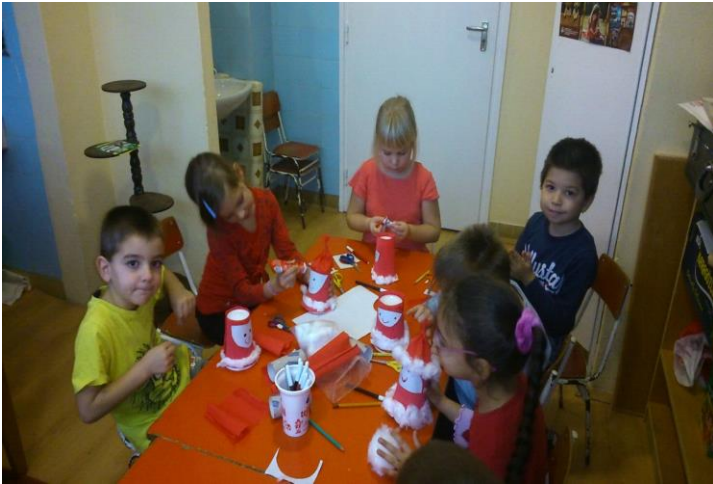
Dolgos kezek tejföls pohárból varázsolnak Mikulást.

A báb „mögé” bújva az anyanyelvi nevelés terén jelentős fejlődést indít, kommunikációs készsége fejlődik, beszéde gördülékenyebb lesz, szókincse, kifejező készsége a mese szövegéből gazdagodik, javul az artikulációjuk a gyerekeknek, hangképző szerveik ügyesednek, de előfordult, hogy a dadogó gyerek a bábbal a kezében folyékonyan beszélt.