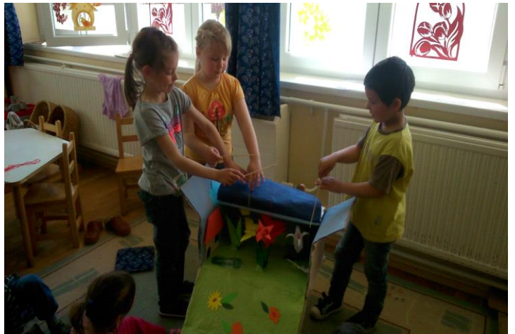
A mese eljátszása a gyerekek előadásában – profin

A csoportomban a gyerekekkel gyakran készítünk bábokat versekhez, dalokhoz vagy egy-egy mese szereplőit elkészítve, díszletet hozzábarkácsolva kezdődhet a bábozás.