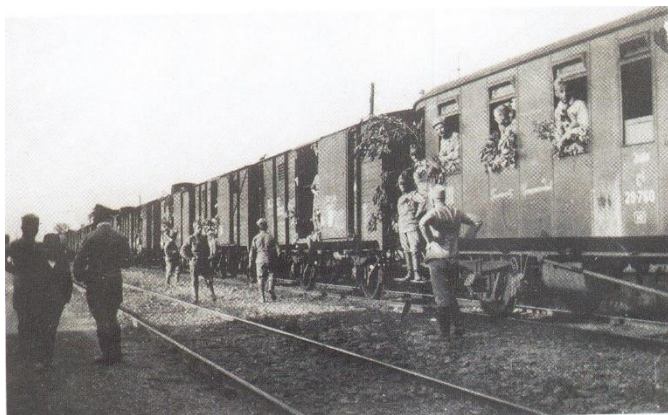
Hadosztályvonat szállítása a szerb harctérre, 1915. április.

1914. május 23-ról 24-re virradó éjszakán az Anfora szigeten Buso kikötőben a Zeffiro olasz romboló megtámadta a szigeten lévő osztrák laktanyát. Ezzel kezdetét vette az olaszok világháborúba való bekapcsolódása. Hadtörténeti szempontból nézve a döntő fontosságú hadműveletek a nyugati és a keleti hadszíntereken zajlottak. „A frontok hosszát és a szemben álló erőket figyelembe véve az olasz front a háború egészéhez képest csupán másodlagosnak számított, ugyanakkor a katonákat ért megpróbáltatásokat és szenvedéseket tekintve éppen ezen a fronton zajlottak le a legkeményebb ütközetek.” „Az olasz-osztrák-magyar frontszakasz harcairól szóló visszaemlékezésekben Isonzó, Doberdó és Piave neve kivétel nélkül gyászos helyet foglal el. A magyar köztudatban különösen rögzült a fennsík névadó kis falujának, Doberdónak a neve, mely fokozatosan az egész frontszakasz elnevezésévé vált. „